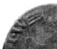
Kon. Bibliotheek Brussel