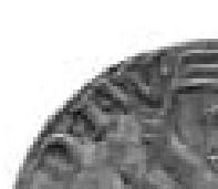
Kon. Bibliotheek Brussel

vz: het wapen van Bologna, een recht-opstaande leeuw lopend naar links met in de klauwen een lans als vaandel. In plaats van het kruis staat in het vaandel een horizontale balk, een fantasieversiering (de Batenburgse exemplaren tonen een schuin kruis). Omschrift: